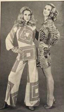
FANTASIE ALLEGRE Un color-blot stampato a geometriamoderno di Milano, presentato da Albo. Albo indossa un abito di lana d'Albo con collo a revers, Milano, Venezia, 2000.