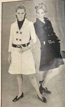
COLLI A UOMO di due il rispetto del sesso: eleganza da indossare in ogni occasione. L'abito bianco è a doppiopetto, il collo ha plissé e lunghi revers a botte. Lo stacco è di reverso nero. Le grandi maniche sono appoggiate.