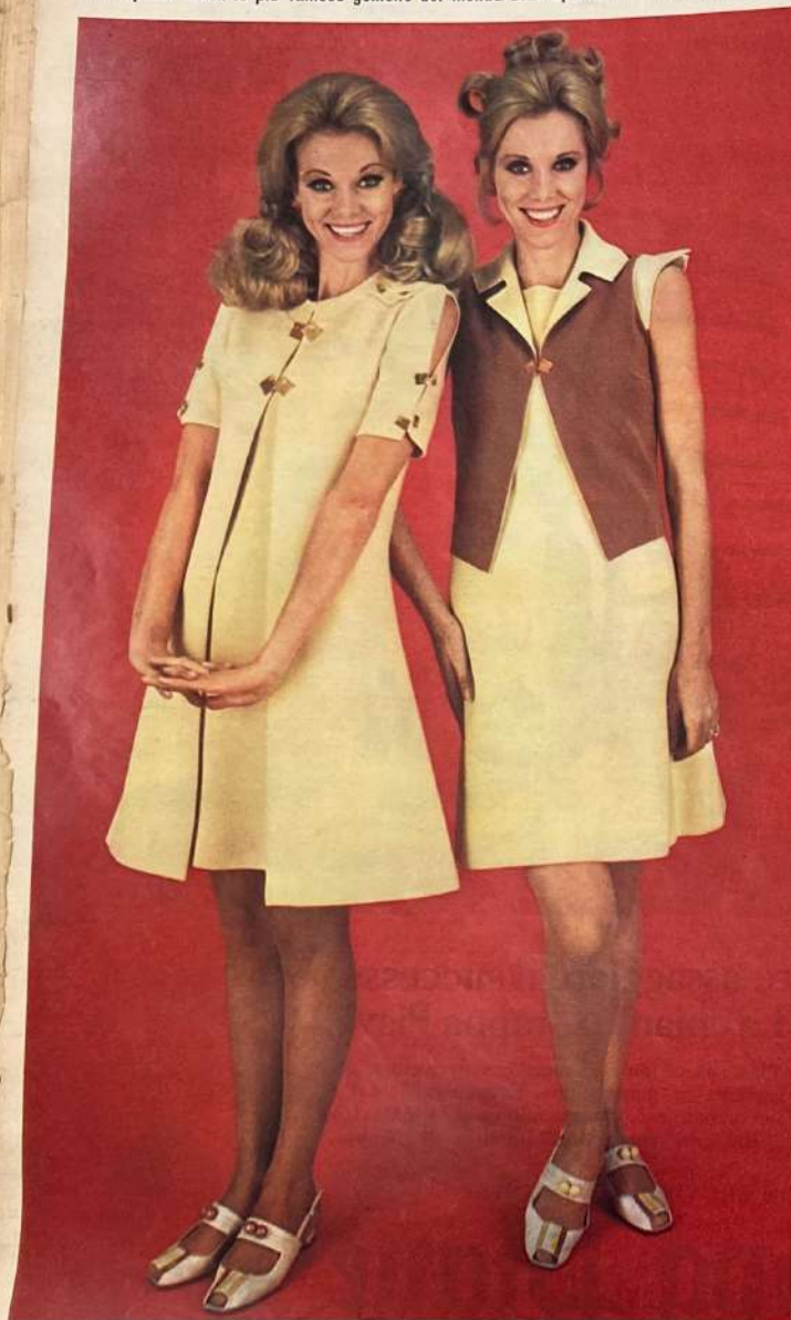
BORCHIE DORATE Belge panna e beige dorato per i due freschi completi in Jersey di maglia presentati da Sartini di Firenze. Ellen indossa, sopra un abito senza maniche, un originale mantello di linea scivolata chiuso con borchie di metallo dorato, collo a listello e maniche corte con taglio verticale ornato da borchie. Alice, un due pezzi di linea morbida con giacca corta dal revers e giromanca sagomati.

Per la prima volta le più famose gemelle del mondo dello spettacolo, le Kessler, posano per un servizio di moda indossando per noi i più originali abiti delle collezioni di alta moda pronta, boutique e maglieria per la primavera-estate 1969, sfilati in questi giorni a Palazzo Pitti