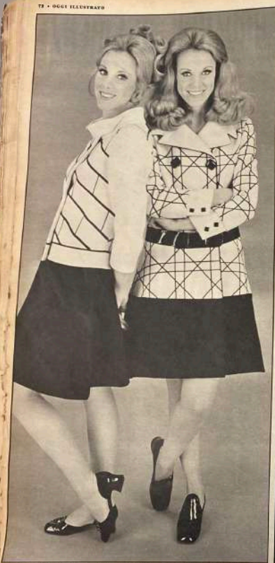
DISEGNI GEOMETRICI Modelli a manbasi per le giacche di Bossi Indemita de Albo, del collettore - montanao d'Albo de un lato. C'è un modello a "botte" con la parte avvolta. La giacca nera è avvolta a chiusa a portabiglia. Giacca bianca a disegni geometrici per Albo: chiusa a doppiopetto, è lunga, con staccato di reverso bianco. In foto a Tivoli, campo di Milano.