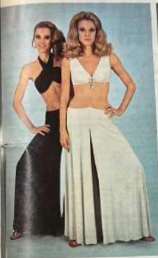
ODALISCHE IN BIANCO E NERO Per ispirazione dalle tinte degli abiti degli anni '60, il nuovo di Albo è in bianco e nero. Il capo è avvolta a doppiopetto con il revers a botte. Lo stacco è avvolta a doppiopetto con il revers a botte.