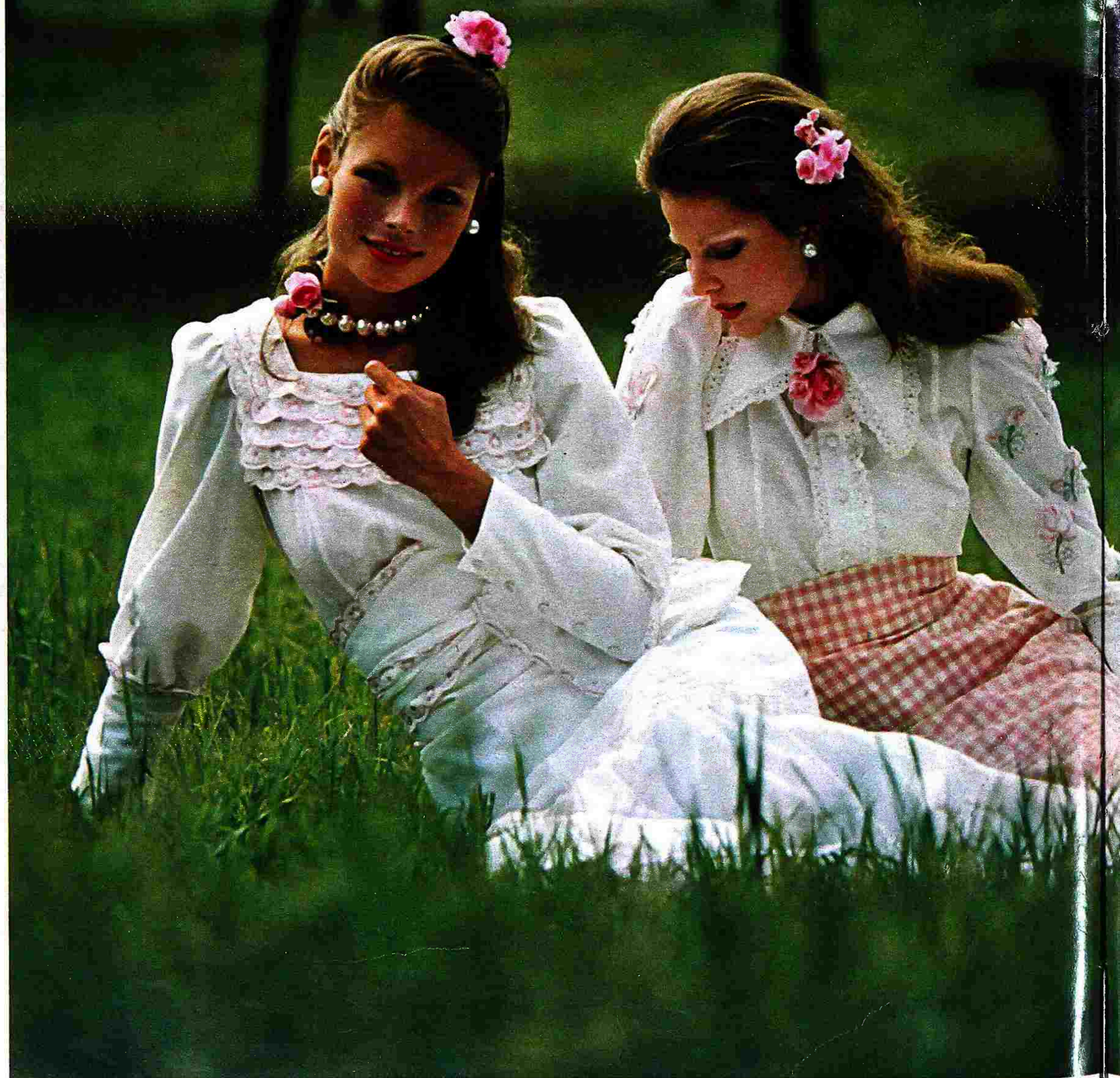
Anche il più disinvolto insieme gonna e camicetta diventa, nella moda sera, molto romantico. Ecco dunque il completo di cotone bianco con blusa dalle maniche a sbuffo e dai volants ricamati, indossata con la gonna svasata. La cintura è a bustino (a sinistra). Poi la blusa con fiori applicati portata con la gonna a quadretti (Elicolaj, Roma). I fiori sono di Bozart, le perle di Fiorucci, le pettinature di Piero per Severgnini