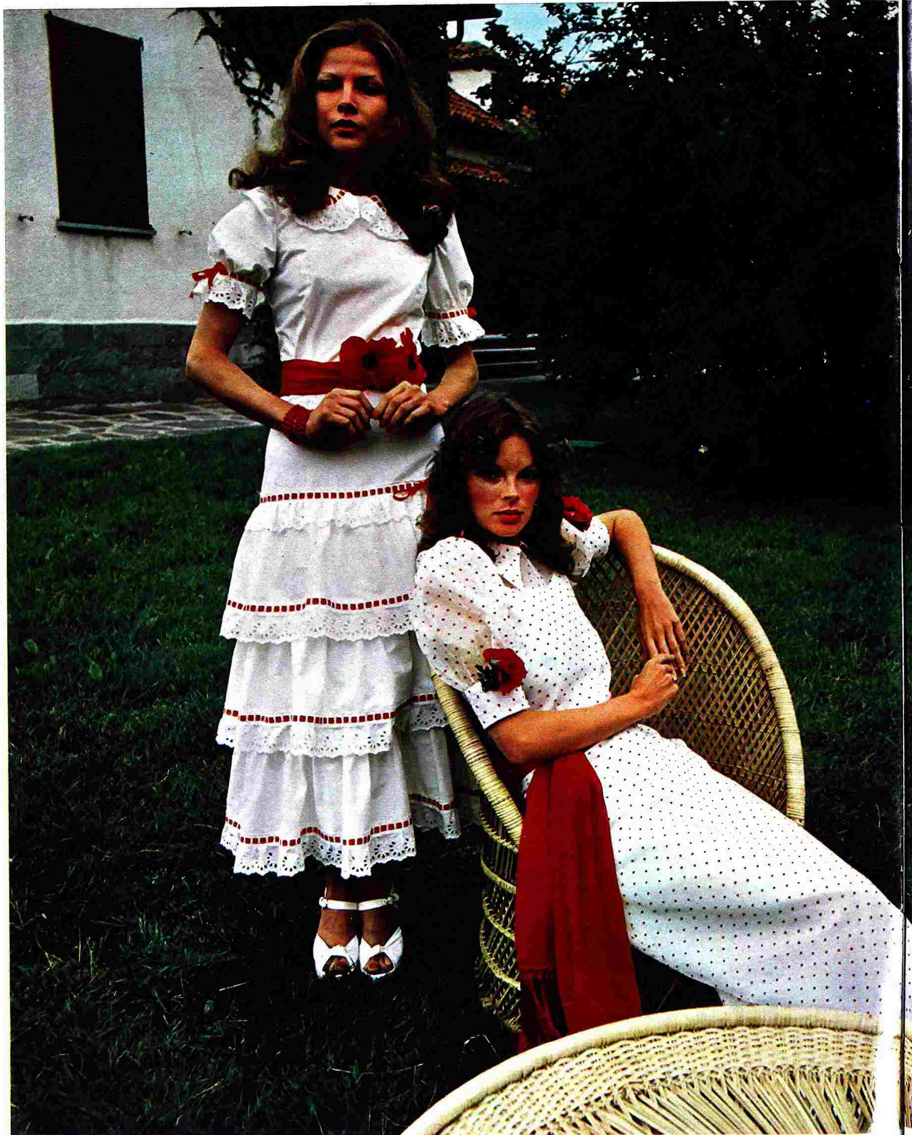
Bianco e rosso per i due abiti « da collegiale », con maniche a sbuffo e colli a camicia. Il primo, di cotone, è completamente profilato di pizzo ed è guarnito da nastri rossi (Nik-Nik). L'altro, in organza « point-d'esprit », ha la gonna appena svasata (Dorothee Bis). Foulard e sciarpa di Salterio, sandali di Moroni. Le acconciature ideali per lo stile romantico hanno capelli sciolti o raccolti, ma sempre morbidi.