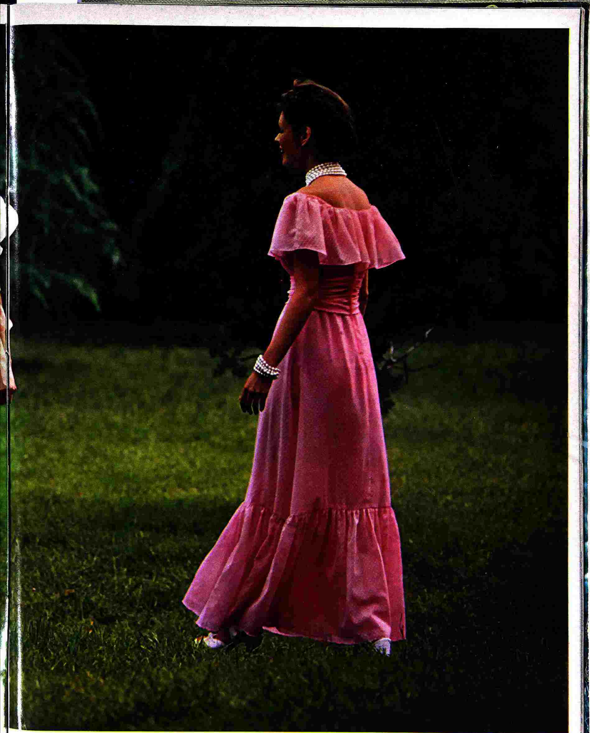
Non potevano mancare gli abiti in tessuto « point-d'esprit », con maniche a sbuffo, ampie scollature e volants arricciati. Il vestito bianco è stretto in vita da una fascia di tessuto rosa pastello (Alberti). L'altro ha la cintura annodata davanti a fiocco (Dorothee Bis). Il fiore fra i capelli è di Correani, quelli in vita sono di Bozart, le perle rosa e quelle naturali sono di Sharra Pagano, le pettinature di Piero per Gianni Severgnini.