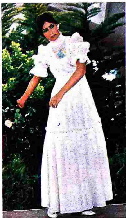
Romina Power indossa un abito lungo fino alla caviglia, di Sangallo bianco, guarnito da volants, ruches e fiori ricamati sul corpino.